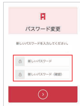
パスワード登録画面

8文字以上かつ以下の4種類から少なくとも3種類の組み合わせであること 小文字(英文字) / 大文字(英文字) / 数字 / 特殊文字